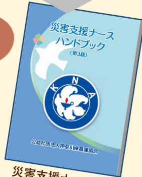
災害支援ナース ハンドブック