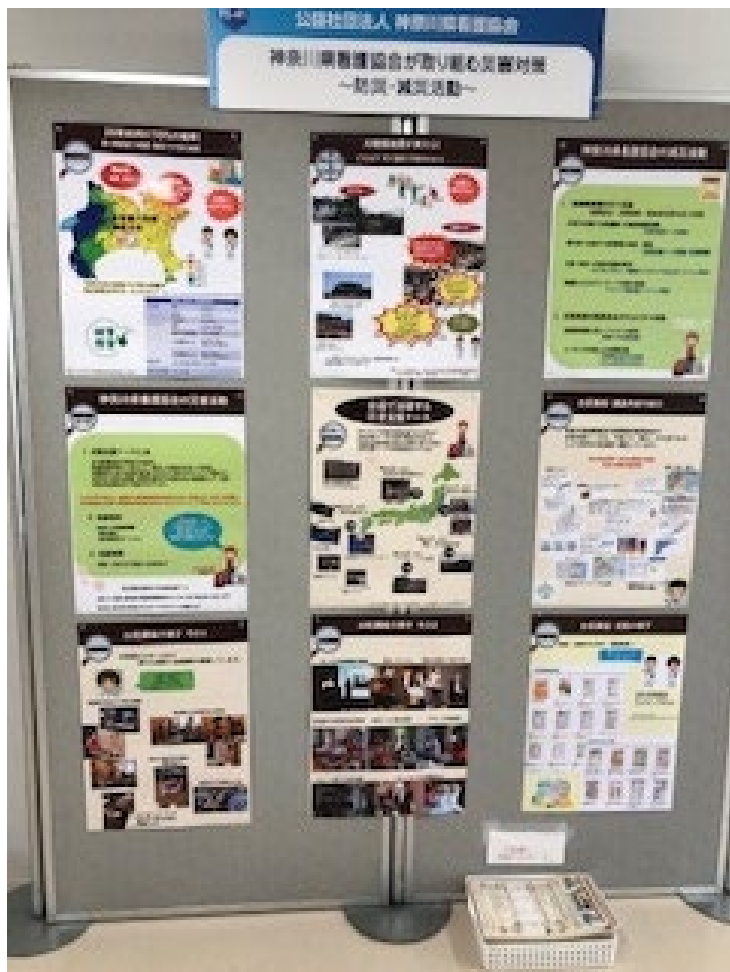
神奈川県看護協会の出展ブース