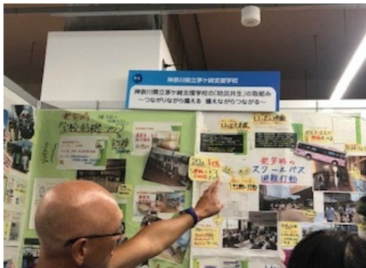
○神奈川県立茅ヶ崎支援学校