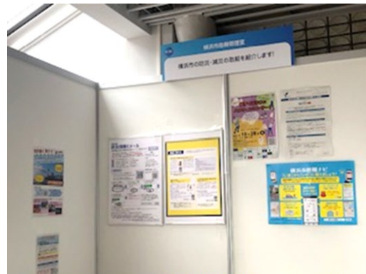
○横浜市危機管理室