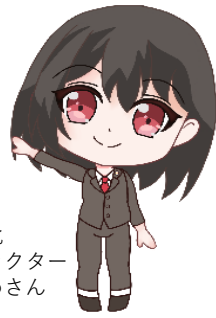
ハローワーク港北 マスコットキャラクター はろうめさん